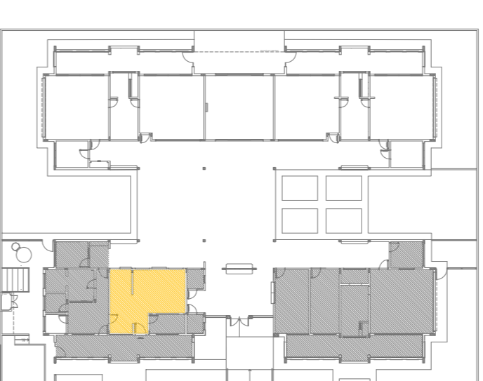
CROQUI DE REFERÊNCIA

FUNDE Fundo Nacional de Desenvolvimento da Educação GOVERNO FEDERAL BRASIL Ministério da Educação PÁTRIA EDUCADORA PROJETO PADRÃO - FUNDE